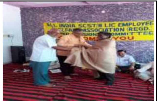
सामाजिक कार्य हेतु संस्थान को सम्मानित करते हुये