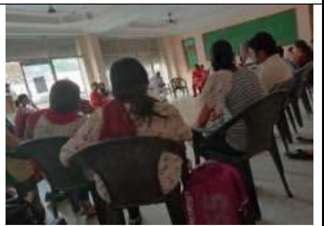
जयपुर में पीयूसीएल के साथ अत्याचारों पर बैठक कार्यक्रम सहभागिता