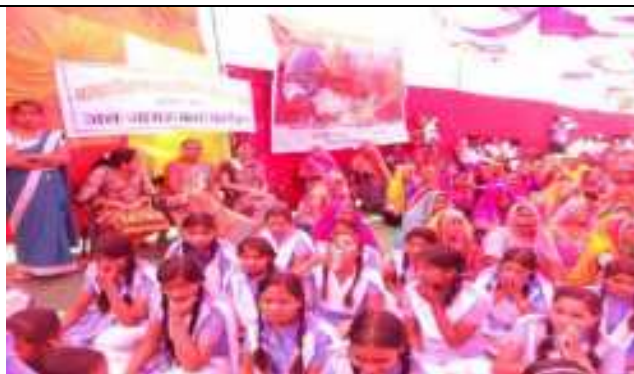
बालिका दिवस पर रा. वि.बालिकाओ के साथ कार्यक्रम का आयोजन