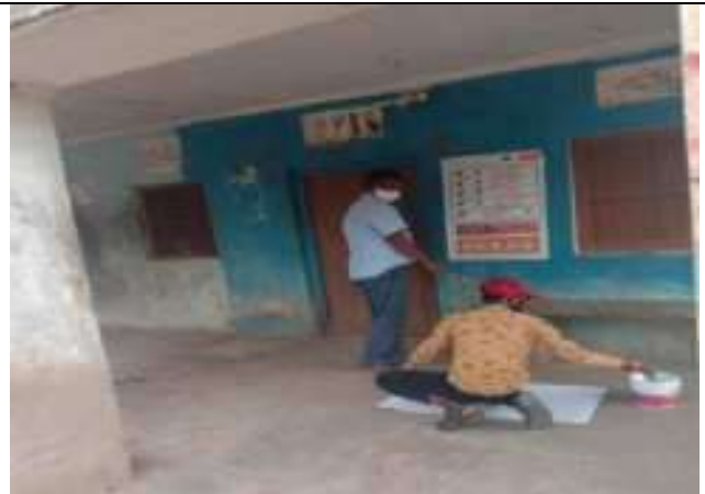
कोविन्ड .19 में लोगो मे जागरूकता सा. दूरी के लिय पोस्टर लगतो