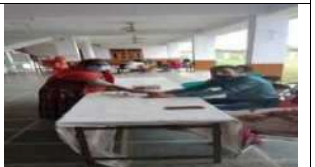
सी. सि. होम (वृद्धाश्रम) भीलवाडा में स्वास्थ्य परिक्षण