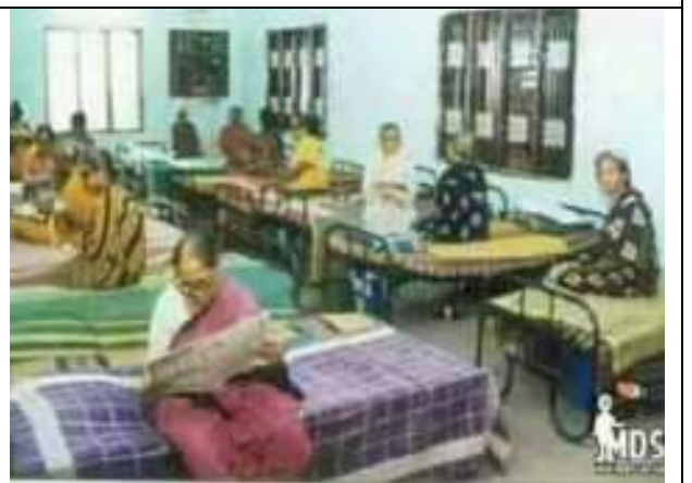
सी. सि. होम (वृद्धाश्रम) भीलवाडा में महिलाएँ आराम करती हुई