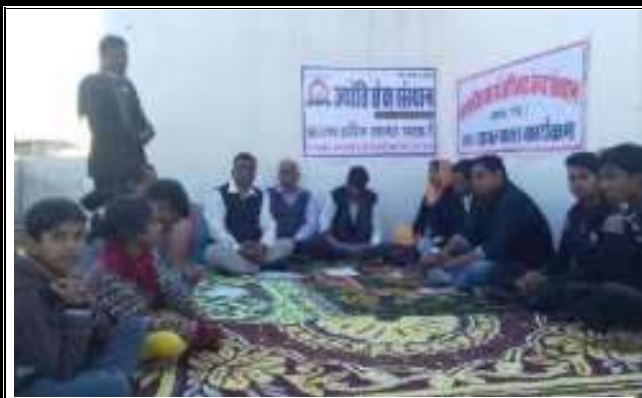
संस्थान द्वारा ज्योति मेच संस्थान केकेडी के साथ अनुसूचित जाति जन जाति अत्याचार निवारण अधिनियम पर कार्यशाला का आयोजन