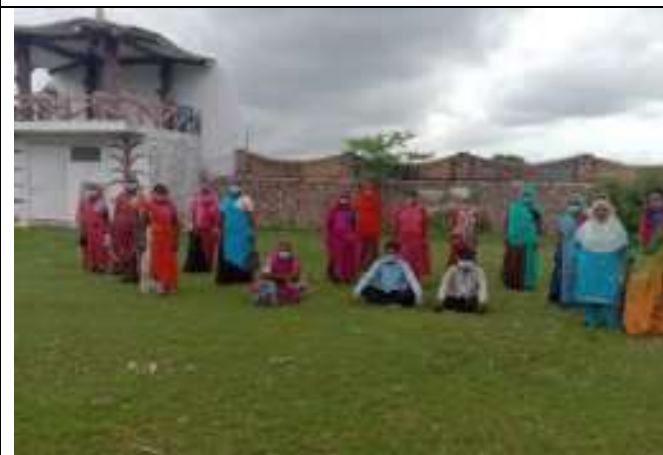
सी. सि. होम (वृद्धाश्रम) भीलवाडा में महिलाएँ योगा करती हुईं