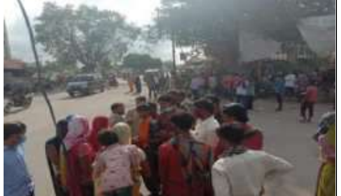
सी. सि. होम (वृद्धाश्रम) भीलवाडा के फील्ड कार्यकर्ता फील्ड में