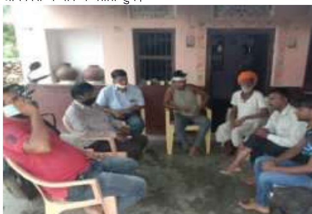
ग्राम सेवरियों में दलित के साथ मारपीट के प्रकरण में पीडित परिवार से मिलकर उसके प्रकरण के बारे जानकारी हेतु यात्रा