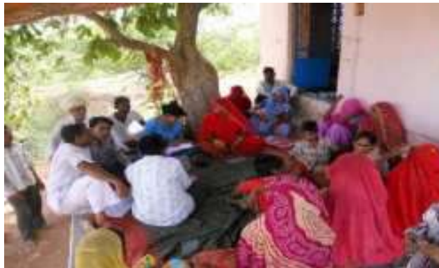
मोंगलियावास मे महिला अधिकारों पर धरेलु हिंसा 2005 कानून पर चर्चा