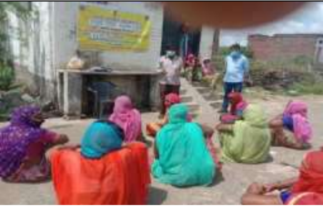
. वृद्ध दिवस के उपलक्ष में गाँवों जागरूकता कार्यक्रम का आयोजन