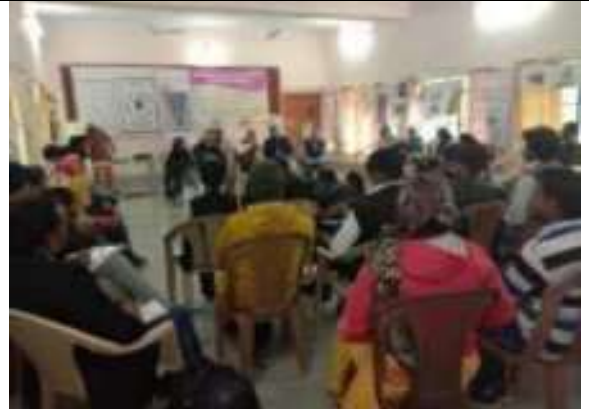
मानवाधिकार विषय पर कार्यशाला में सहभागिता