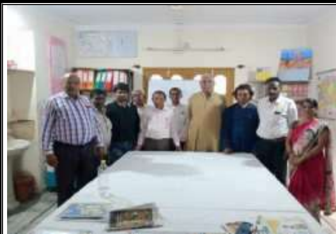
संस्थान द्वारा मुक्तिधारा संस्थान के साथ कार्यक्रम सहभागिता