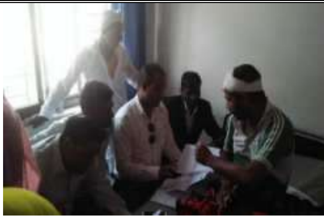
संस्थान के विधिक परामर्श केन्द्र द्वारा किशनगढ में पीडित से प्रकरण की जानकारी लेते हुये अधिवक्तागण