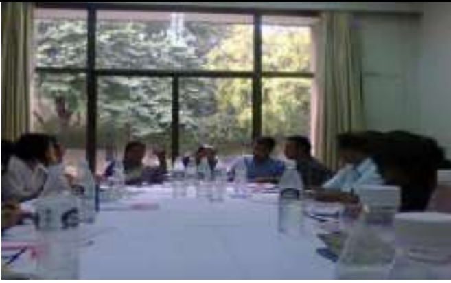
संस्थान की सलाहकार समिति की बैठक का आयोजन