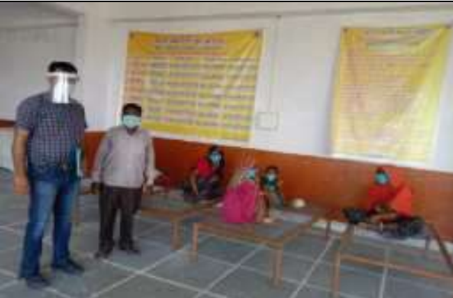
सी. सि. होम (वृद्धाश्रम) भीलवाडा भवन का निरीक्षण करते हुये