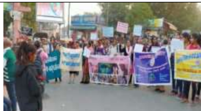
सहयोगी संगठनों साथ एन सी आर के विरोध में रैली में सहभागिता