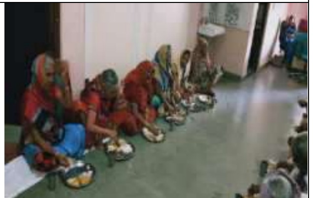
सी. सि. होम (वृद्धाश्रम) भीलवाडा में महिलाएँ खाना खाती हुई