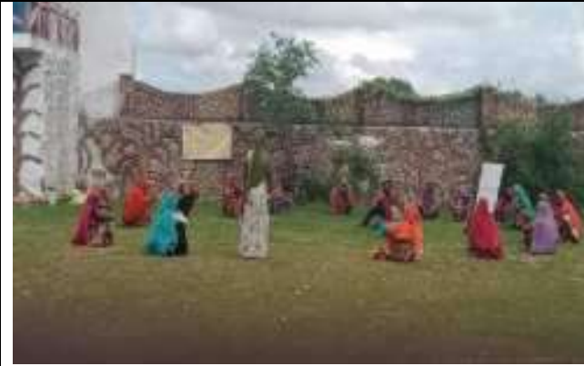
सी. सि. होम (वृद्धाश्रम) भीलवाडा में महिलाएँ योगा करती हुई