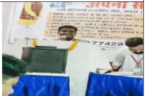
सा. न्याय यात्रा का संस्थान व संगठनों द्वारा स्वागत बैठक