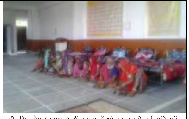
सी. सि. होम (वृद्धाश्रम) भीलवाडा में भोजन करती हुई महिलाएँ