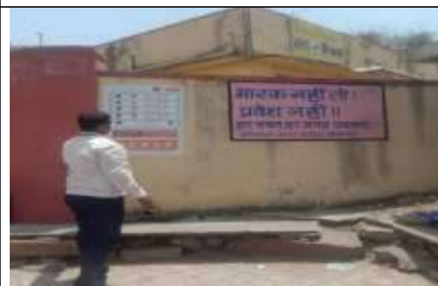
कोविन्ड .19 में गाँवों में सामाजिक दूरी व मास्क लागाने की अपील