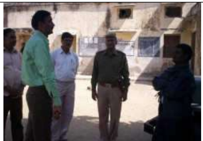
मतदान केन्द्र भौवता पर संस्थान के पदाधिकारी निरीक्षण करते हुये