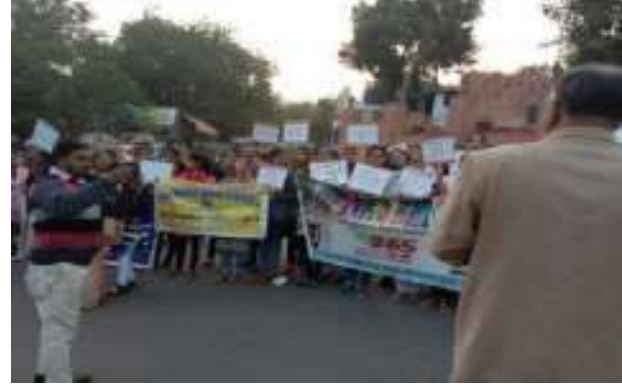
सी सी ए/एन सी आर के विरोध में विरोध प्रदर्शन रैली का