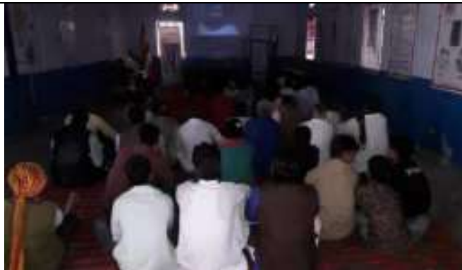
सरकारी योजनाओ पर कार्यशाला का आयोजन