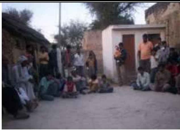
अन्तराष्ट्रिय जनसंख्या दिवस पर जागरूकता कार्यक्रम का आयोजन