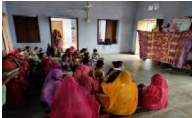
संस्थान द्वारा ग्राम रूपनगढ में महिला संशक्तिकरण जागरूकता मे पपेट शो माध्यम से जागरूकता कार्यक्रम का आयोजन