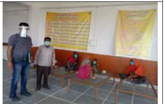
सी. सि. होम (वृद्धाश्रम) भीलवाडा में निनीस्टी RRTC द्वारा निरीक्षण