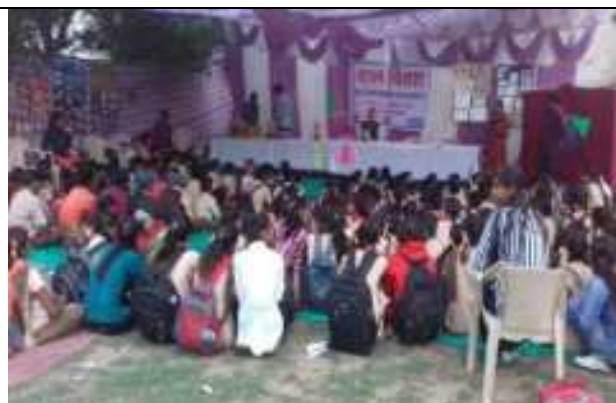
एड्स दिवस पर जागरूकता कार्यक्रम का आयोजन