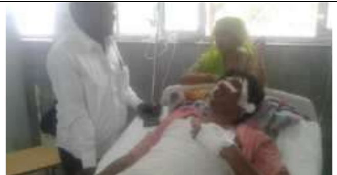
मारपीट में धायल की जानकारी लेते हुए संस्थान के पदाधिकारी