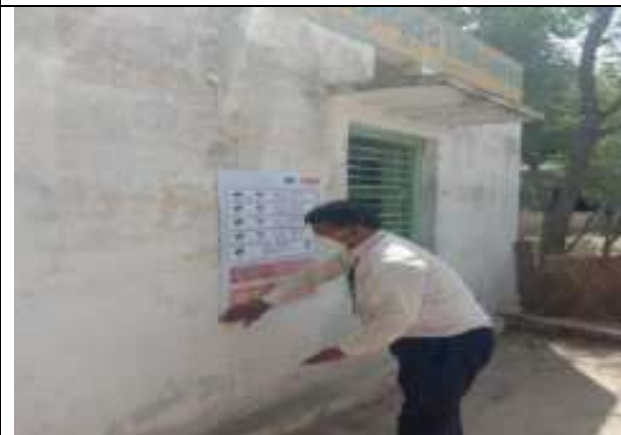
कोविन्ड .19 में गरीबो को खाद्द सामाग्री वितरण करते हुये