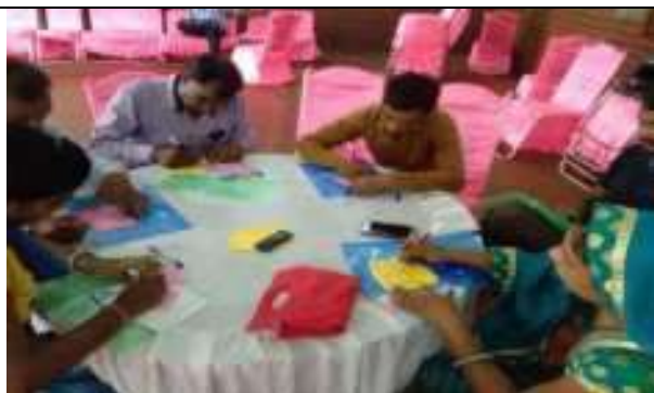
विश्व स्वास्थ्य दिवस पर चित्र प्रतियोगिता कार्यशाला का आयोजन