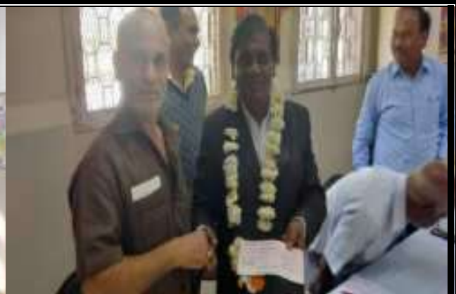
अ.भा बुद्धि वेलफेयर सोसाइटी की ओर से संस्थान का सहयोग राशि प्रदान करते हुये