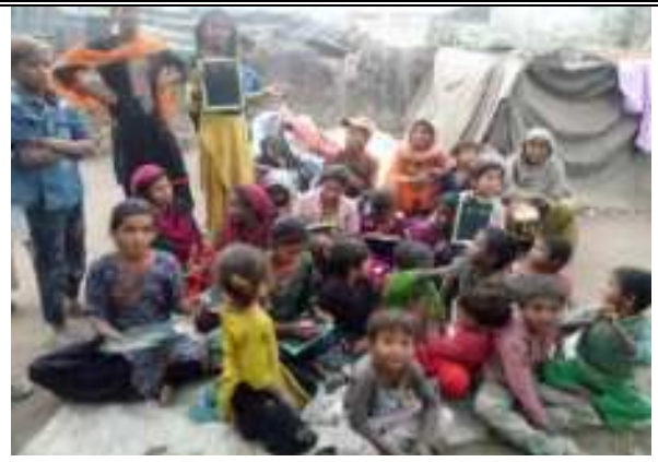
मिरासी परिवार के बच्चो/महिलाओं को शिक्षा जोडने हेतु शिक्षा पाठशाला का आयोजन