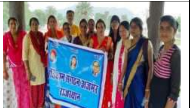
कोरो इडिया संविधान दिवस पर कार्यशाला का आयोजन