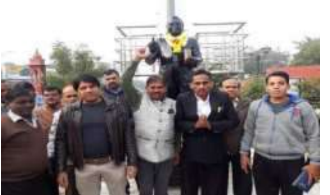
सहयोगी संगठनों के साथ डॉ अम्बेडकर जयन्ती पर माल्यार्पण