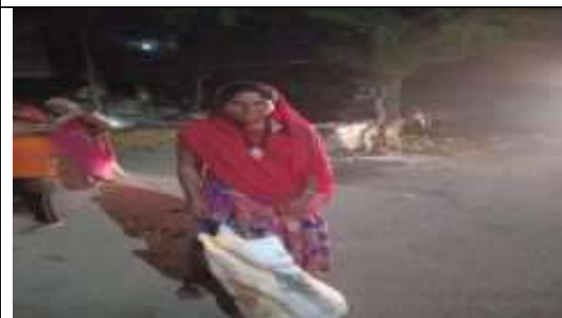
कोविन्ड .19 में गरीबो को खाद्द सामाग्री वितरण करते हुये