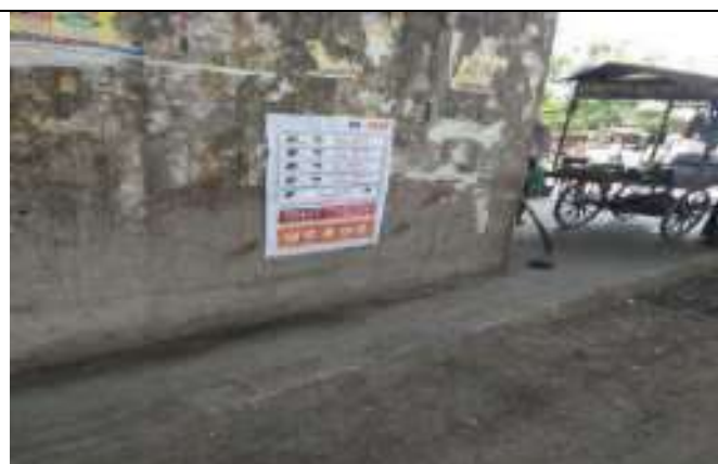
कोविन्ड .19 में कोरोना के खिलाफ पोस्टर जागरूकता