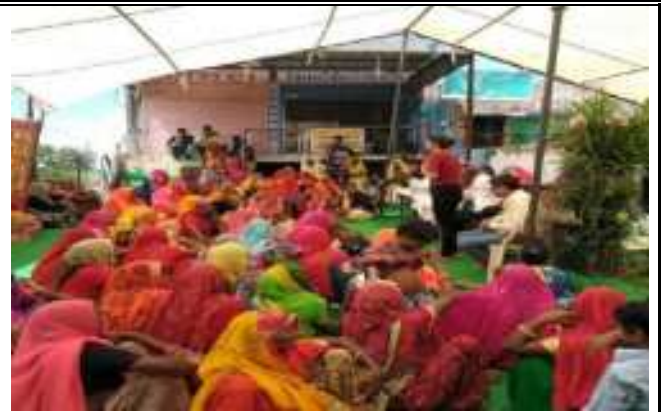
मई दिवस/मजदूरी दिवस पर मजदूर सम्मेलन का आयोजन