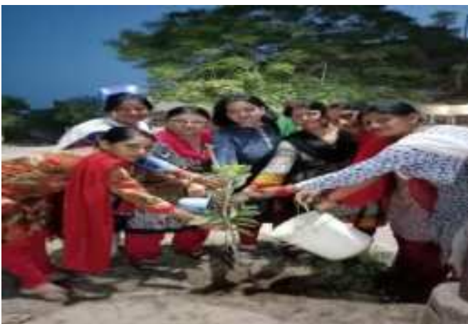
महिला दिवस पर पौधारोपण का कार्यक्रम का आयोजन