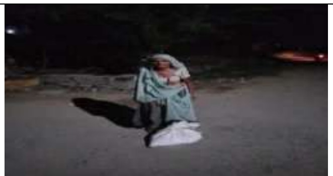
कोविन्ड .19 में गरीबो को खाद्द सामाग्री वितरण करते हुये