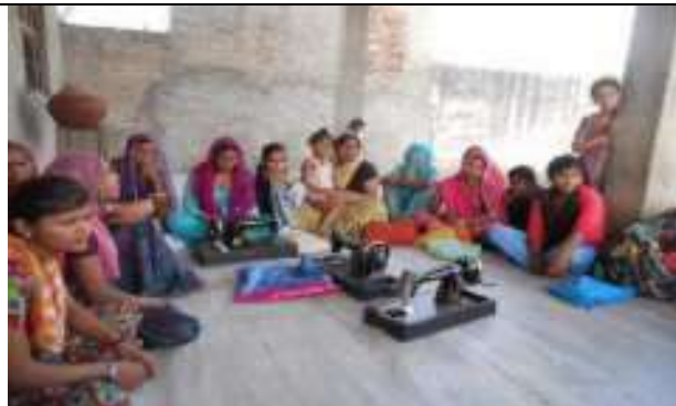
संस्थान द्वारा सिलाई सेन्टर कार्यक्रम