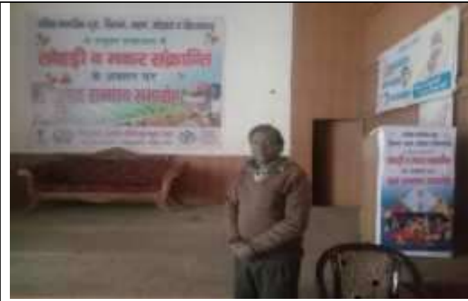
सी. सि. होम (वृद्धाश्रम) चौबीसी संस्थान के कार्यक्रम सहभागिता