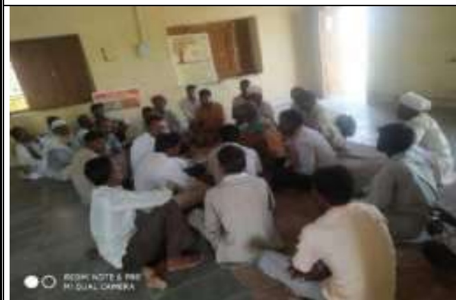
केकडी में कानूनी शिविर का आयोजन