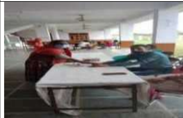
सी. सि. होम (वृद्धाश्रम) भीलवाडा में डॉ द्वारा जाँच करते हुये