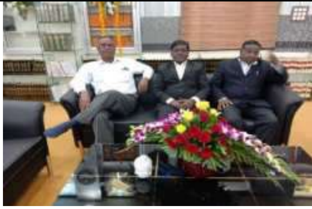
संस्थान एडवोकेट समूह