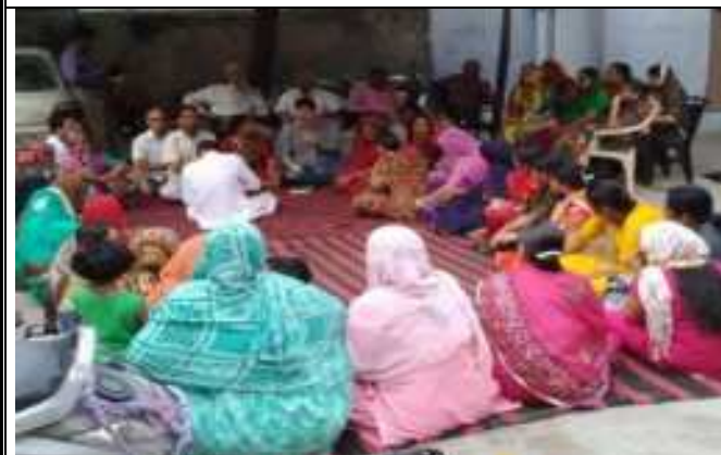
अ. उपभोक्ता दिवस पर उपभोक्ता जागरूकता कार्यक्रम का आयोजन