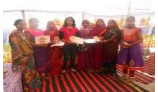
बलिका शिक्षा को बढावा एवं प्रोत्साहन के लिये उनहे प्रस्तिति पत्र देकर उनको प्रोत्साहित किया गया।