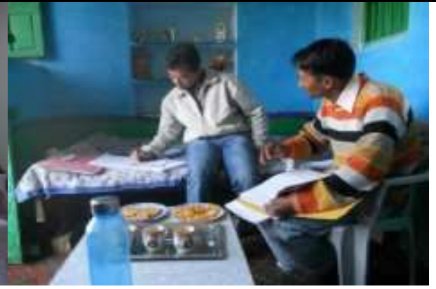
समाजिक अध्ययन केन्द्र जयपुर के पदाधिकारी के साथ गाँव की आवास की समस्याओं पर संस्थान के साथ चर्चा करते हुये।