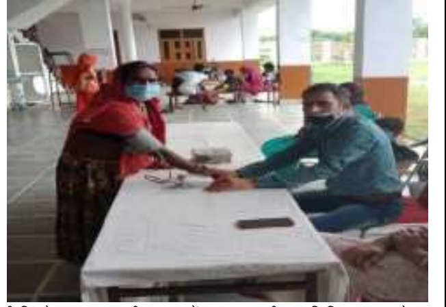
सी.सि.होम (वृद्धाश्रम)भीलवाडा में स्वास्थ्य परीक्षण शिविर का आयोजन