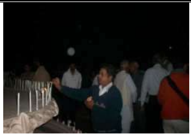
गँधी जयन्ती पर श्रद्धाजलि कार्यक्रम का आयोजन