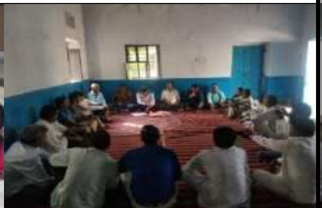
हिन्दी दिवस पर हिन्दी भाषा पर संगोष्ठी कार्यक्रम का आयोजन