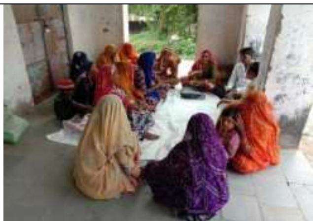
संस्थान के महिला समूह SHG की बैठक का आयोजन