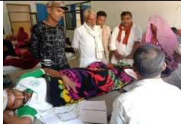
ब्यावर में दंबगो द्वारा मारपीट प्रकरण संस्थानकीफैक्ट फाईडिंग टीम