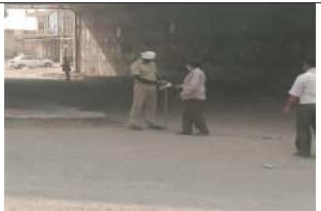
कोविन्ड .19 में द्वारा पुलिसकर्मीश्यों का मास्क वितरण करते हुये