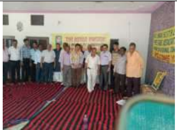
भा.जी.बी.नि.बुदिष्ठ वेलफेयर सोसाइटी के साथ बैठक