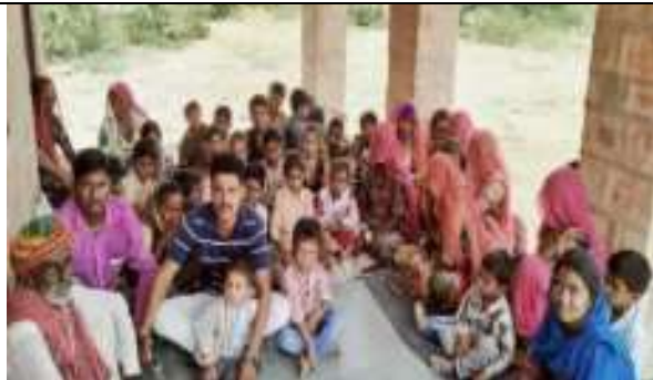
मिरासी परिवारों के साथ उनकी समस्याओं लेकर बैठक