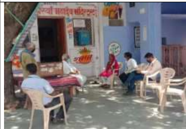
(वृद्धाश्रम) भीलवाडा के महिलाएँ योगा करती हुई