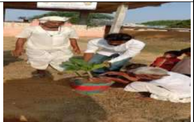
पौधारोपण कार्यक्रम में पौधारोपण करते हुये