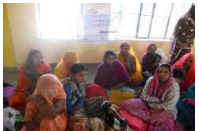
महिला सशक्तिकरण एवं कुप्रथाओं पर एक दिवसीय कार्यशाला का आयोजन किया गया।