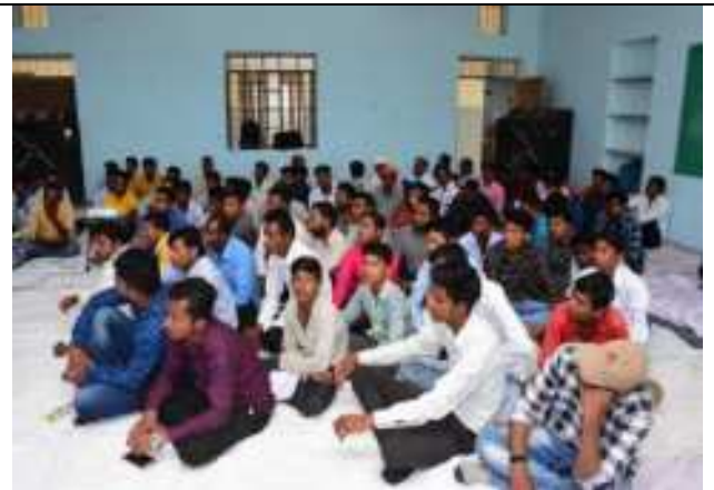
धूमपान निषेध दिवस पर जागरूकता बैठक का आयोजन