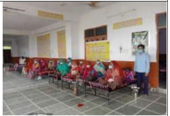
सी. सि. होम (वृद्धाश्रम) भीलवाडा के होम अधीक्षक