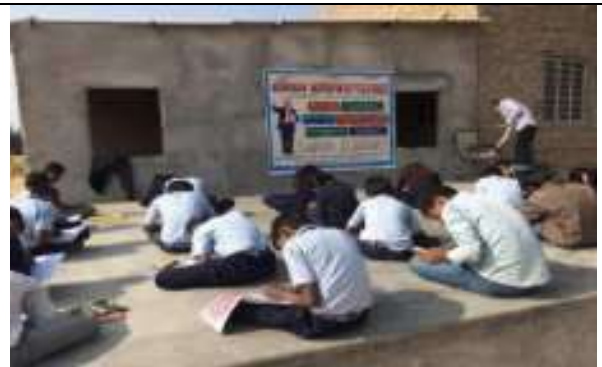
डॉ. अम्बेडकर जयन्ती पर चित्र प्रतियोगिता आयोजन