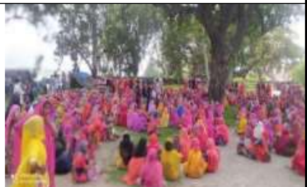
नेरगा कार्यस्थल पर कानूनी जागरूकता शिविर का आयोजन