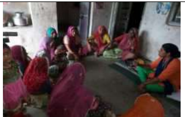
महिला समूह की बैठक का आयोजन