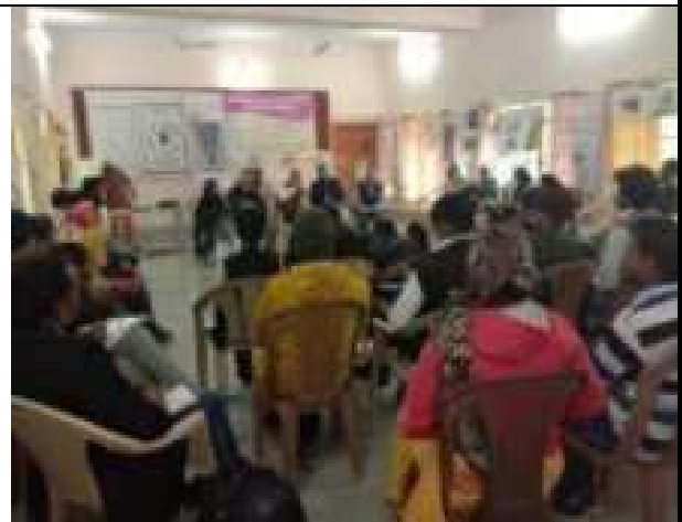
मानवाधिकार विषय पर मानवाधिकार संगठनों के साथ दो दिवसीय कार्यशाला का आयोजन मे सहभागिता