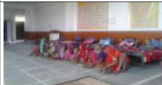
सी. सि. होम (वृद्धाश्रम) भीलवाडा में महिलाएँ