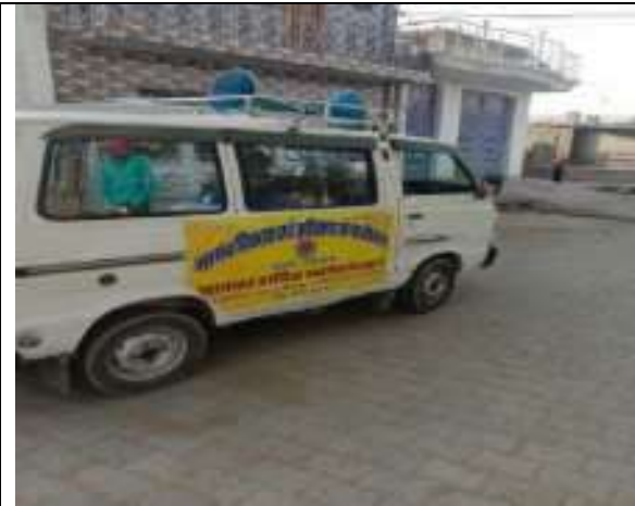
मोबाइल बेन द्वारा कोविन्ड .19 में लोगो मे जागरूकता कार्यक्रम