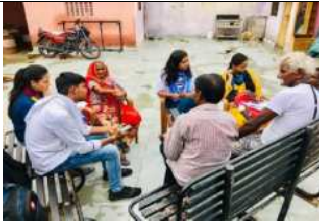
नसीराबाद के ग्राम बेबन्जा डायन प्रकरण की जानकारी लेते संस्थान एव पीयूसीएल के की टीम