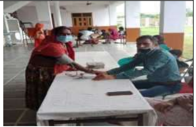
सी. सि. होम (वृद्धाश्रम) सप्ताहिक मेडीकल कैम्प का आयोजन