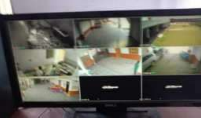
सी. सि. होम (वृद्धाश्रम) भीलवाडा में सी सी टी कैमरों का संचालन