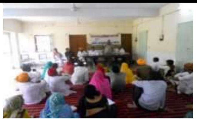
अत्याचारों पर एक दिवसीय जनसुनवाई का कार्यक्रम का आयोजन