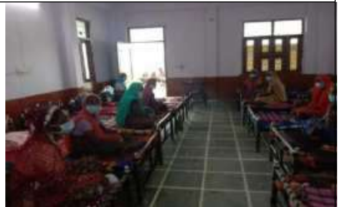
सी. सि. होम (वृद्धाश्रम) भीलवाडा में महिलाएँ गीत गाती हुईं