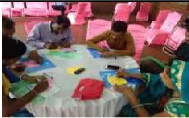
विश्व स्वास्थ्य दिवस पर चित्र प्रतियोगिता कार्यशाला का आयोजन