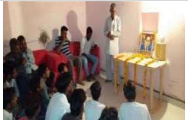
डॉ. अम्बेडकर परिनिवारण दिवस पर संगोष्ठी का आयोजन