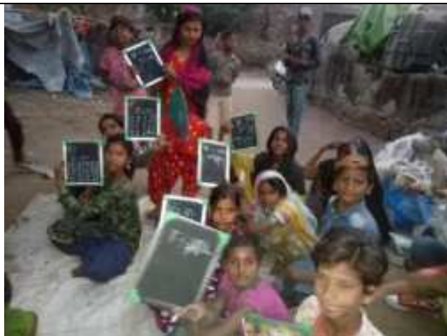
संस्थान द्वारा कालबेलिया परिवार के बच्चो का शिक्षा जोडने हेतु बाल पाठशाला का आयोजन