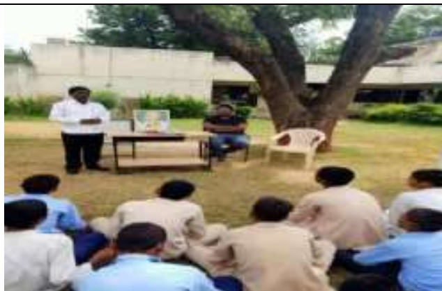
समाज कल्याण विभाग के सम्प्रेण गृह में समाज कल्याण सप्ताह मनाते हुये