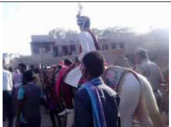
संस्थान ग्राम चाचियावास में पुलिस पहरें में दलित की बरात