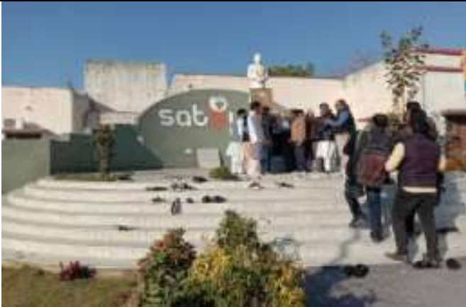
संस्थान द्वारा नेहरू जयन्ती पर माल्यार्पण का कार्यक्रम का आयोजन