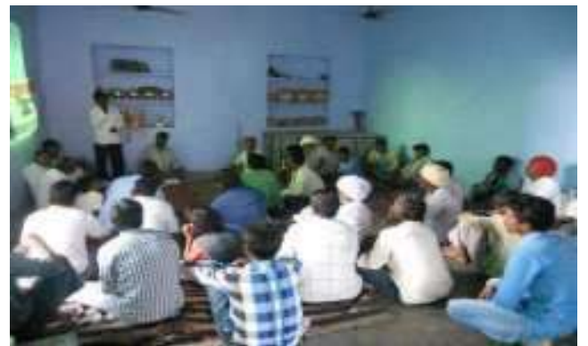
सरकारी योजनाओ पर कार्यक्रम उनके अधि.कारों के बारे चर्चा करते उनकी विभिन्न समस्याओं पर चर्चा की गई।