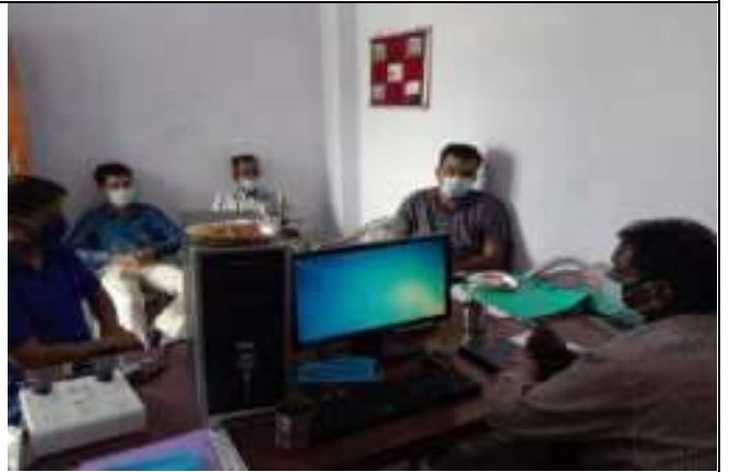
सी. सी.सि. होम(वृद्धाश्रम) भीलवाडा मे का. निनीस्टी RRTC निरीक्षण