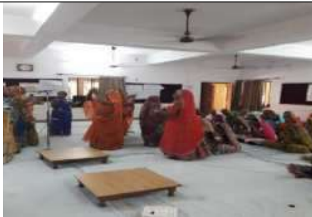
महिला दिवस पर संगीत कार्यक्रम का आयोजन