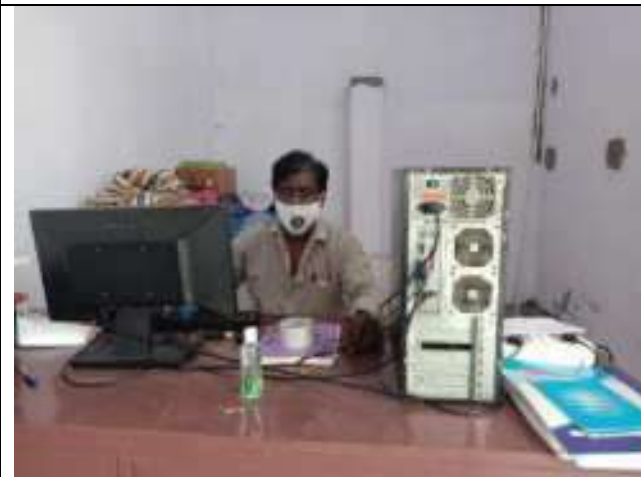
सी. सि. होम (वृद्धाश्रम) भीलवाडा के कार्यालय में करते संस्थान सचिव