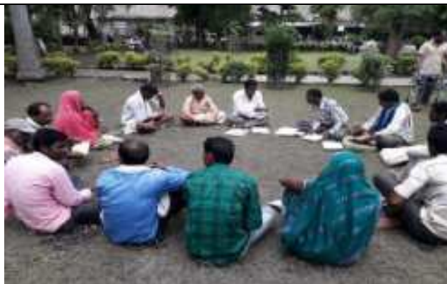
फादर्स दिवस पर संगोष्ठी बैठक का आयोजन