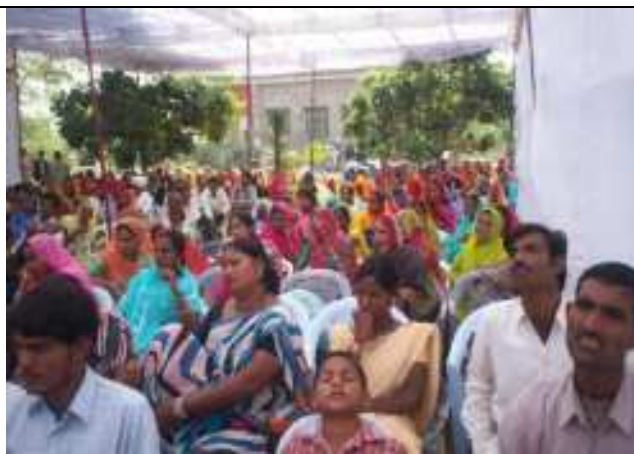
अ.सद्भावना दिवस पर सद्भावना सम्मेलन का आयोजन