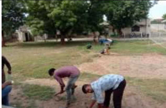
श्रम दिवस पर श्रमदान करते हुये संस्थान के कार्यकर्तागण