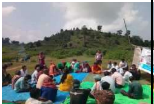
पंचायत राज कानूनों के बारे कार्यशाला का आयोजन