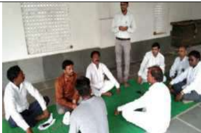
टीचर डे पर शिक्षा और अध्यापक विषय पर संगोष्ठी