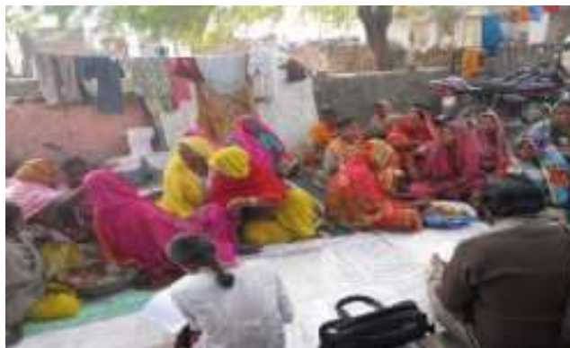
संस्थान द्वारा में अन्तराष्टिय मातृत्व दिवस के अवसर पर उनके अधिकारों में बारे मे बताते हुये।