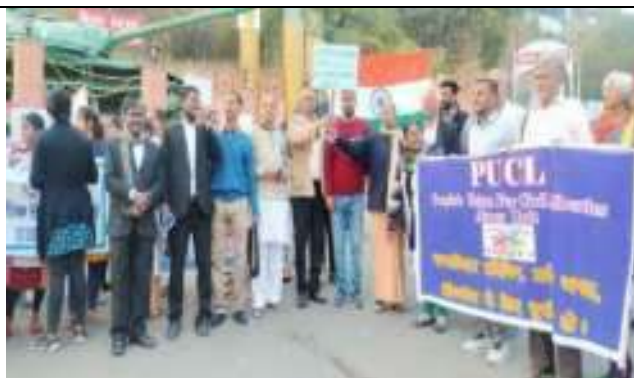
पीयूसील अजमेर के साथ N.R.C. के विरोध मे रेली में सहभागिता