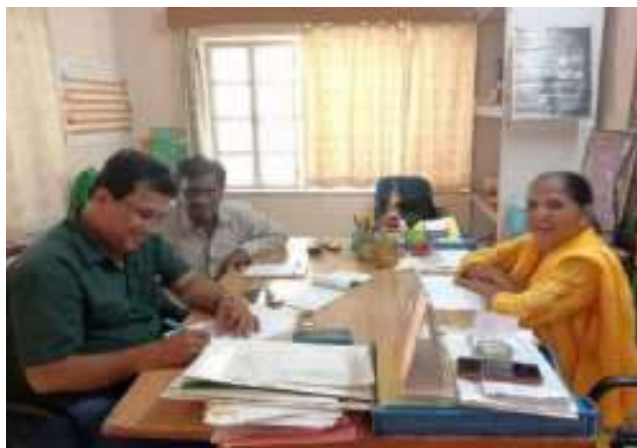
पु. का. हत्या प्रकरण फैक्ट फाईडिंग महिला विकास भीलवाड़ा में चर्चा