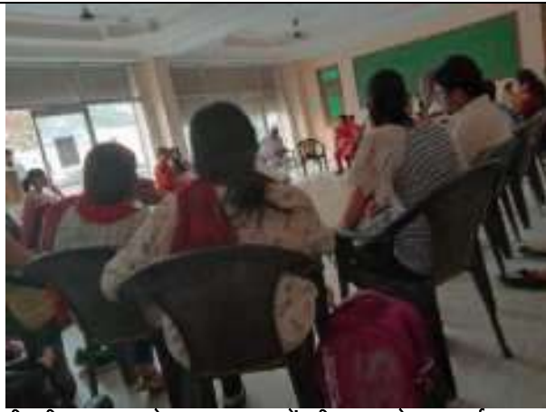
पीयूसील जयपुर के साथ अत्याचारों की घटनाओं पर चर्चा