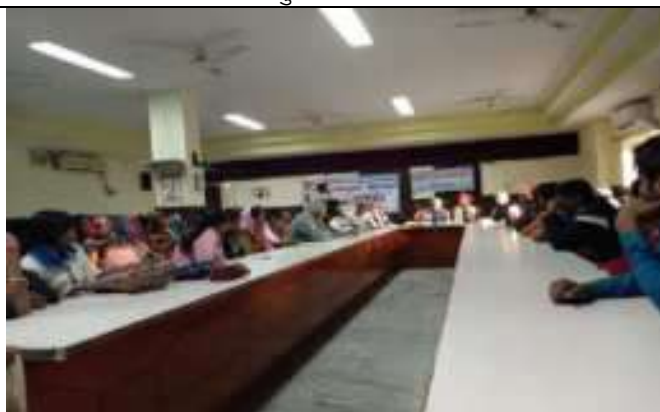
सा. न्याय यात्रा का संस्थान व संगठनों द्वारा स्वागत बैठक