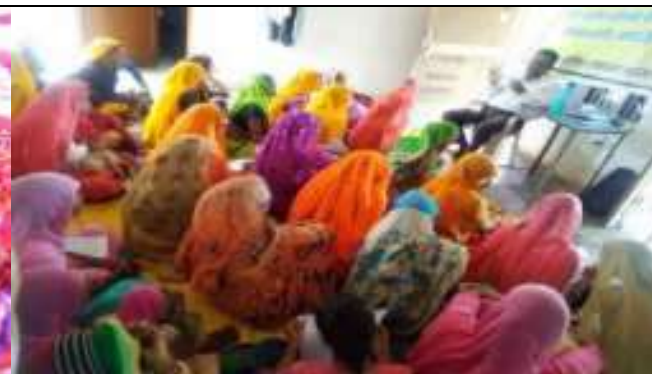
संस्थान के महिला समूह SHG की बैठक का आयोजन