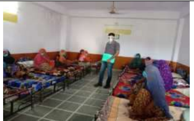
सी.सि. होम(वृद्धाश्रम)भीलवाडा में RRTC सदस्य द्वारा निरीक्षण करते हुये