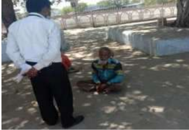
सी. सि. होम (वृद्धाश्रम) भीलवाडा के माध्यम से गरीबों मास्क वितरण