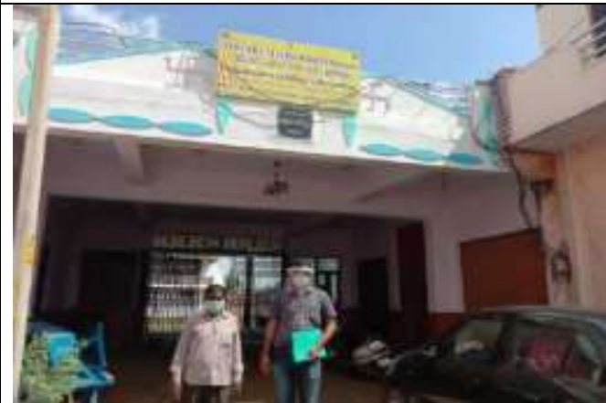
सी. सि. होम (वृद्धाश्रम) भीलवाडा में RRTC सदस्य के साथ