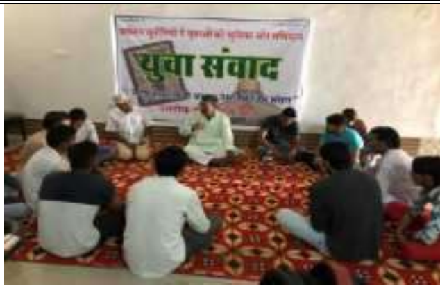
युवा दिवस पर युवा संवाद कार्यक्रम का आयोजन