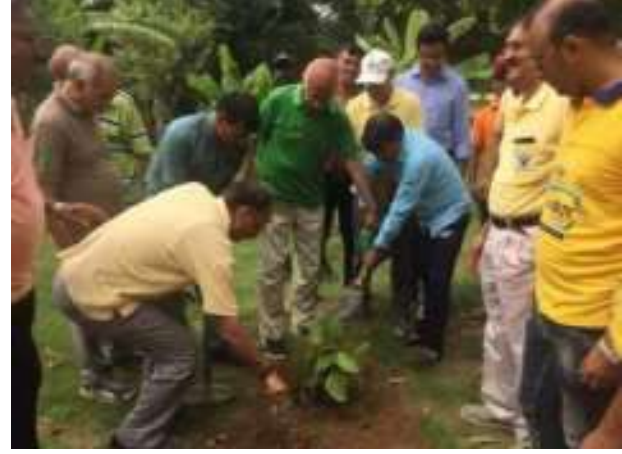
नेशनल पर्यावरण दिवस पर पौधारोपण कार्यक्रम