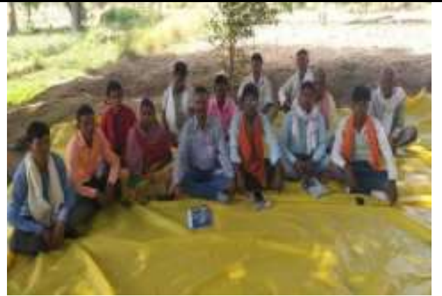
किशनगढ ब्लॉक कमेटी की बैठक का आयोजन